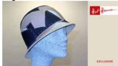
Angebot Nr. 16