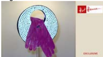
Angebot Nr. 17