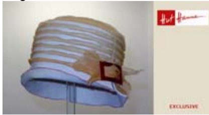
Angebot Nr. 1

Ladenöffnungszeiten: Mo.-Fr. 9:30 - 19:00 Uhr Sa. 9:30 - 17:00 Uhr