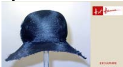
Angebot Nr. 5