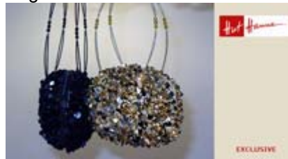
Angebot Nr. 18