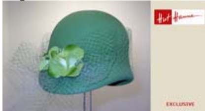
Angebot Nr. 3

superleichter Filz mit Organzagarnitur Preis: 398,00 €