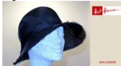
Angebot Nr. 6