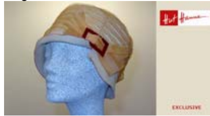
Angebot Nr. 2

superleichter Filz mit Organzagarnitur Preis: 398,00 €